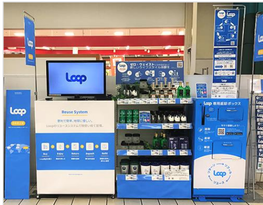
↑ 店頭に設置された容器の回収ボックス（千葉県）