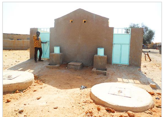
↑ 日本のODAによって設置されたトイレ (セネガル)

→ 世界では、支援を必要とする開発途上国の経済発展や福祉向上のために、ODA（政府開発援助）によって、資金や技術を提供する国際協力活動が行われています。