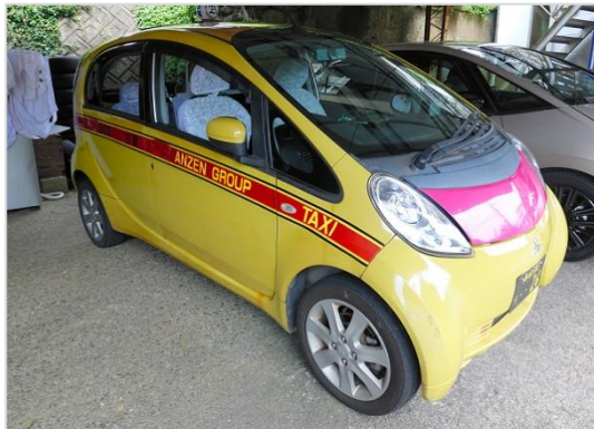
↑ せまい道でも走れる小型の電気自動車を 活用したタクシー（長崎県）

世界各国で、ガソ リン車の販売を規制 して、電気自動車を 普及する取り組みが 進められています。 地球温暖化の主な原 因となる二酸化炭素 の排出をおさえる動 きが高まっています。