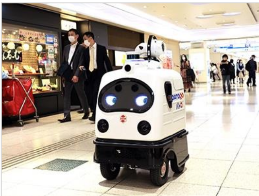
↑ 無人警備・消毒ロボット「パトロ」(東京都)