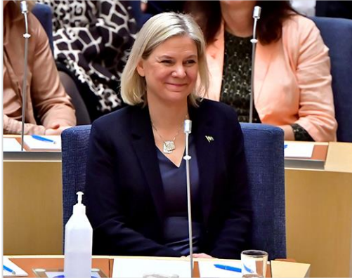
↑ 首相に選ばれた女性議員 (スウェーデン)

写真提供: 協力: AFP=時事 出典: IPU「Global data on national parliaments(2023年12月)」/ 令和2年度少子化社会に関する国際意識調査(内閣府)